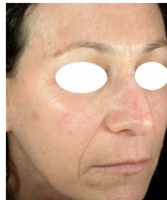
Pacienta tratata cu Photo Genesis, Laser Genesis si Titan