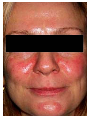
Pacienta tratata cu Photo Genesis si Laser Genesis

În paralel cu peelingul laser (vezi Cutera Pearl sau Pearl Fractionat), obtinem Rejuvenarea 3D expres.